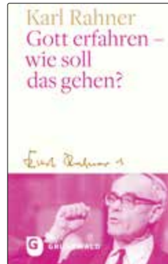
Karl Rahner Gott erfahren – wie soll das gehen?

Das Wort »Gott« kommt nicht nur in Gebets- sprache vor, sondern ist auch sonst in aller Munde: von »um Gottes willen« bis zu »Ach, du lieber Gott«. Doch gibt es diesen Gott wirklich? Und wenn ja, lässt er sich persönlich erfahren – so persönlich, wie es die sogenannten Mystikerinnen und Mystiker beschreiben? Muss man für eine solche Erfahrung spirituelle Höchstleistung betreiben? Nein, sagt Karl Rahner, und er zeigt auf, dass und wie jeder Mensch Gott erfahren kann – sofern man sich dabei von magischen Vorstellungen fernhält.