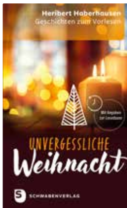
Heribert Haberhausen Unvergessliche Weihnacht Geschichten zum Vorlesen für Gemeindearbeit, Gottesdienste und Seniorenguppen

Zusätzlich enthalten: weitere Modelle für Fest- und Gedenktage sowie für besondere Anlässe wie einen Bußgottesdienst oder einen Rorate-Gottesdienst.