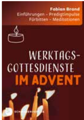
Fabian Brand Werktagsgottesdienste im Advent Einführungen – Predigtimpulse – Fürbitten – Meditationen

15 x 21 cm, 152 Seiten Paperback € 22,- [D] / ISBN 978-3-7966-1836-9